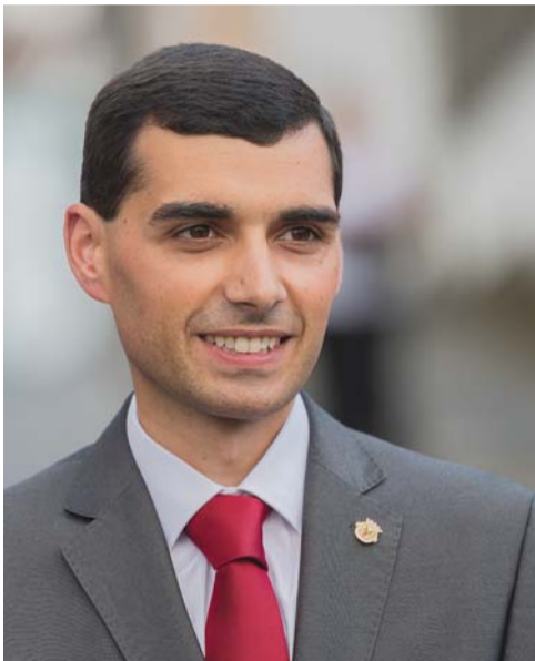
O autarca Tibério Dinis afirma que visitar a Praia da Vitória é uma experiência única