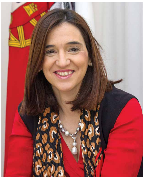
Edil acredita na união dos açorianos para incentivar o turismo interno

Estamos ainda na ressaca de um período difícil devido ao novo coronavírus. Que consequências maiores regista no concelho de Lagoa?